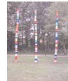
„Waltroper Ringel-Riesen“ – aus 3 Baumstämmen werden Landmarks.

Neben den bis hierher beschriebenen Kunstaktionen, die ich noch weiter modifizieren kann, arbeite ich auch frei nach Themen mit festen Gruppen (z. B. Schulklassen). Sie müssen nur ein Thema vorgeben, dann komme ich zu einem Brainstorming-Treffen zu Ihnen. Die weitere Planung und Durchführung der Aktion liegt dann in meinen Händen. Hier zwei Beispiele von Gruppenarbeiten aus den letzten Jahren. Mehr Beispiele im Internet. Durchklicken auf „Außer der Reihe“.