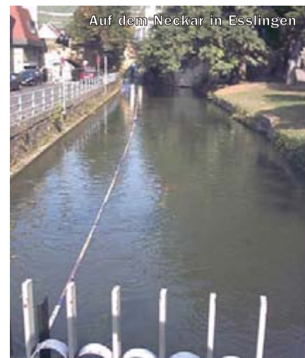
Auf dem Neckar in Esslingen

Eine farbkraftige Schlange, die auf dem Wasser schwimmt – das ist der erste Eindruck, wenn man die Flussinstallation „Wasserlinie“ sieht. Die Schlange besteht aus armdicken und ca. 2 m langen Hölzern, die z. B. von den Besuchern einer Veranstaltung bemalt werden. Nach dem Trocknen des wasserfesten Lackes füge ich die Hölzer mit Hilfe von Ringschrauben zu einer langen Kette zusammen, nicht selten über hundert Meter. Das erste Holz wird mit einem Strick und einem dicken Stein auf dem Flussgrund fixiert und alle folgenden immer weiter angehängt. So kann die Schlange sich mit der Strömung bewegen, schwimmt aber nicht weg! Die Natur – der Fluss – und die Kunst – die „Wasserlinie“ – gehen so eine wunderschöne Verbindung ein, steigern sich wechselseitig in ihrer Wirkung. Ein Augenschmaus, wenn man von einer Brücke aus den sanften Bewegungen der „Wasserlinie“ folgt!