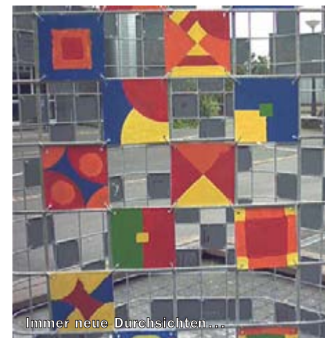
Immer neue Durchsichten...