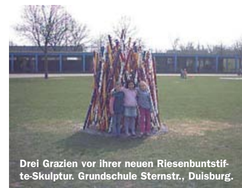
Drei Grazien vor ihrer neuen Riesenbuntstifte-Skulptur. Grundschule Sternstr., Duisburg.

Riesenbuntstifte-Skulpturen bestehen aus armdicken, 2 Meter langen, angespitzten imprägnierten und vorlackierten Rundhölzern, die in einer Malaktion, z. B. von der Schülerschaft einer ganzen Schule oder den Besuchern einer Veranstaltung, mit schönen Mustern bemalt werden. Jeder einzelne Buntstift sieht für sich schon toll aus, er strahlt mit seinen klaren Farben Lebendigkeit, Freude und Kreativität aus. Dieser Ausdruck wird aber noch gesteigert, wenn ich aus den Riesenbuntstiften eine Skulptur baue. Das kann dann – je nach Anzahl der Stifte – ein mächtiges „Trumm“ werden, sieht aber dennoch leicht und filigran aus – ein echter farbenfroher Hingucker für jeden Platz!