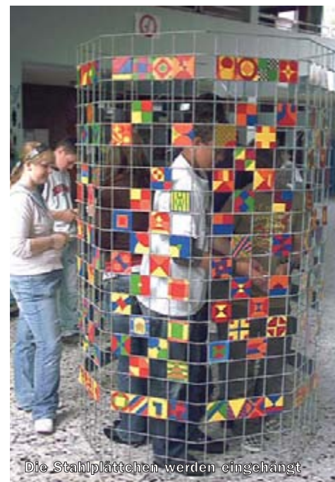
Die Stahlplättchen werden eingehängt

Bedingungsrahmens (Farben, Formen). Die Stahlplättchen werden dann durch eingestanzte Löcher mit Draht in die „Fenster“ eingeklinkt, anschließend die „Schülersäule“, z. B. auf dem Schulhof, im Boden einbetoniert. Das ist schon ein toller Anblick, wenn man das Kunstwerk umkreist! Je nach Blickwinkel entstehen immer neue Farbkombinationen. Aber das Beste kommt noch: Das Kunstwerk ändert sich jedes Jahr! Die Entlass-Schüler können nämlich ihre Stahlplättchen als Andenken an ihre Schulzeit mit nach Hause nehmen. Die neuen Schüler wiederum bemalen neue Plättchen, die wieder eingeklinkt werden. Dieses Kunstwerk bringt mehreres: Es repräsentiert als farbiger Eyecatcher die ganze Schule, gleichzeitig aber auch die Individualität jedes einzelnen Schülers – und es ist dynamisch, ändert sich jedes Jahr durch die neuen Jahrgänge.