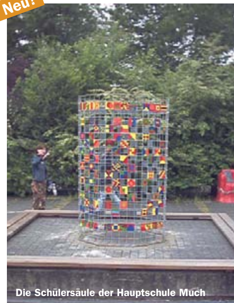
Die Schülersäule der Hauptschule Much

Man stelle sich eine verzinkte Baustahlmatte vor: ein kaltes, banales und technisches Etwas, bestehend aus ca. 1 cm dicken Rundstahl-Stäben, die waagrecht und senkrecht mit entsprechenden „Fenstern“ (ca. 10 x 10 cm) aneinandergeschweißt sind. In meiner Aktion wird sie zu einem Trägergerüst für eine „Schülersäule“ oder eine „Schülerwand“, und das geht so: Die Matte wird aufrecht stehend mehrfach gebogen, sodass eine Säule mit viereckigem oder achteckigem Grundriss entsteht, und an den Enden zusammengeschweißt. Diese Arbeiten führt ein Fachbetrieb durch. Jeder Schüler einer Schule bekommt nun ein verzinktes und bereits vorgründiertes Stahlplättchen von 10 x 10 cm, auf das er seine persönliche „Flagge“ oder sein persönliches „Wappen“ malt – natürlich innerhalb eines definierten